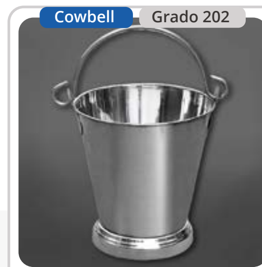
SKU: BD13INOX Balde Acero Inoxidable 13 Lts.