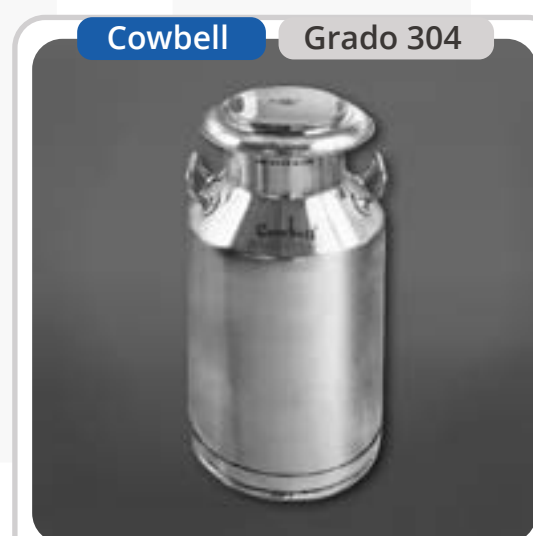
SKU: BL50INOX Bidón Lechero 50 Litros