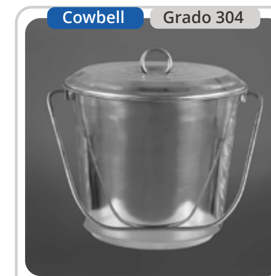
SKU: BD5CTINOX3 Balde Acero Inoxidable 5 Lts.