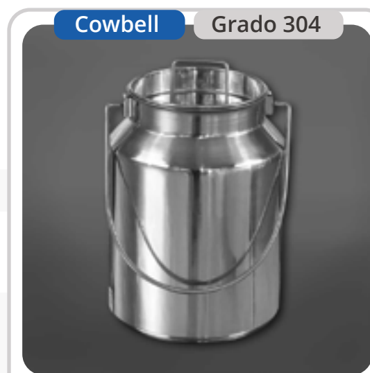
SKU: BL5INOX Bidón Lechero 5 Litros