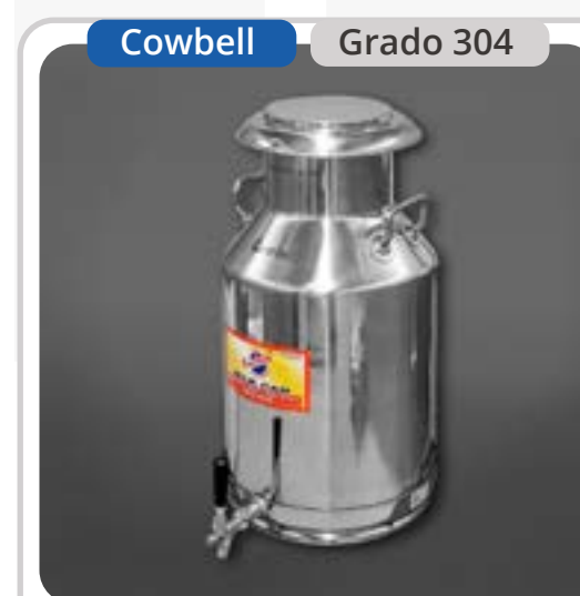
SKU: BL40INOXCLL Lechero de 40 Lts con Llave