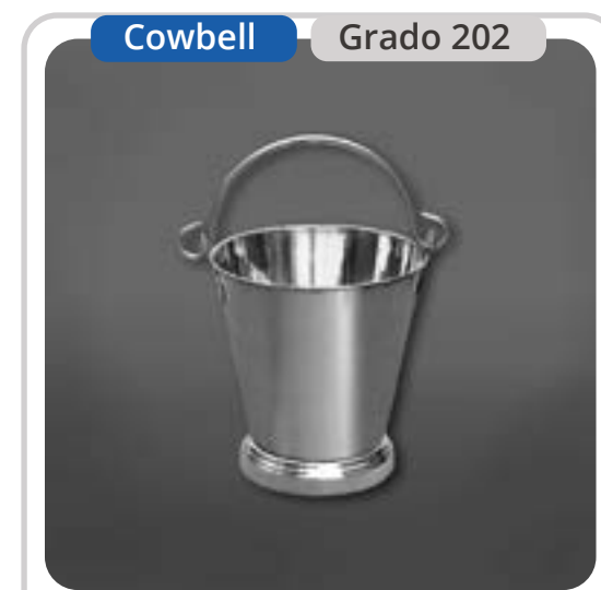
SKU: BD5INOX Balde Acero Inoxidable 5 Lts.

Estos baldes han sido diseñados especialmente para la industria alimenticia, aunque también son aptos para aplicaciones químicas y de laboratorio. Fabricados en una sola pieza, permiten un lavado perfecto y garantizan higiene y resistencia. Su construcción robusta y estable, junto con la manilla plegable y fuerte, facilitan su operación. La tapa con anillo cubre completamente el balde, asegurando protección. Su acabado pulido tipo espejo entrega una imagen elegante y sofisticada, ideal para uso en alimentos, eventos e industria, con una vida útil proyectada de hasta 30 años, lo que los convierte en una opción duradera y sostenible.