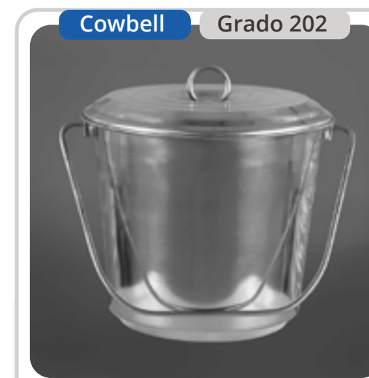
SKU: BD5CTINOX Balde Acero Inoxidable 5 Lts.