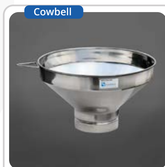
SKU: BEMBINOX Embudo Colador Acero Inoxidable