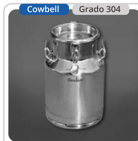
SKU: B20INOX Bidón Lechero 20 Litros Sellable