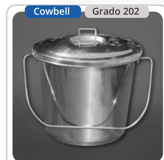
SKU: BD10CTINOX Balde Acero Inoxidable 10 Lts.