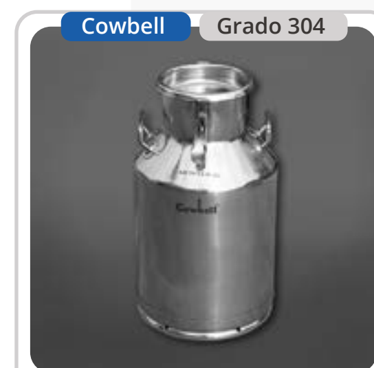
SKU: B40INOX Bidón Lechero 40 Litros Sellable