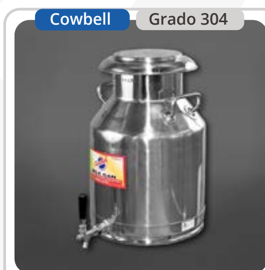
SKU: BL30INOXCLL Lechero de 30 Lts con Llave