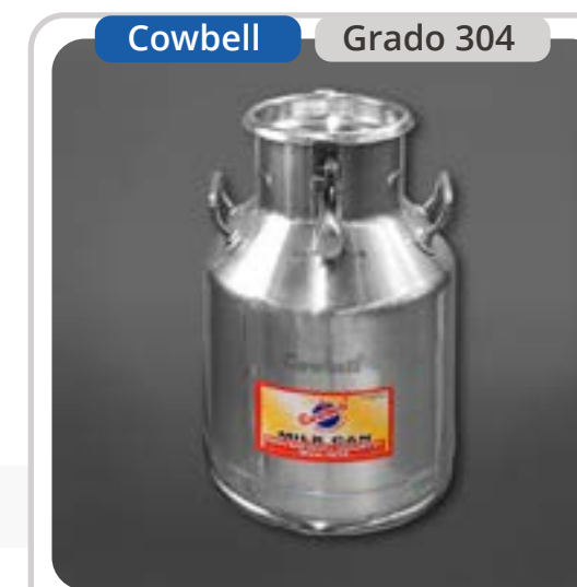
SKU: B30INOX Bidón Lechero 30 Litros Sellable