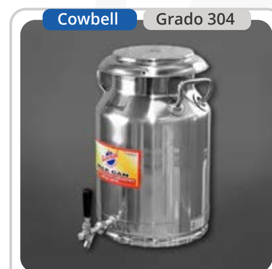
SKU: BL20INOXCLL Lechero de 20 Lts con Llave

Los bidones lecheros con llave se destacan por su elegancia clásica, durabilidad, y facilidad de uso, además de ser respetuosos con el medio ambiente. Equipados con un grifo sofisticado para una dispensación precisa, su tapa hermética es fácil de manejar. Son versátiles, utilizados en la industria alimentaria, hogares, casinos y restaurantes. Su acabado espejo no solo es visualmente atractivo, sino que también facilita la limpieza y fomenta la reutilización, representando una alternativa ecológica a los contenedores de plástico.