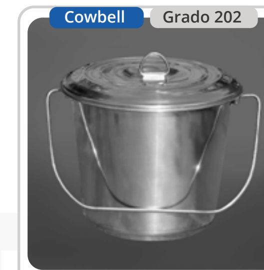
SKU: BD7CTINOX Balde de Acero Inoxidable 7 Lts.