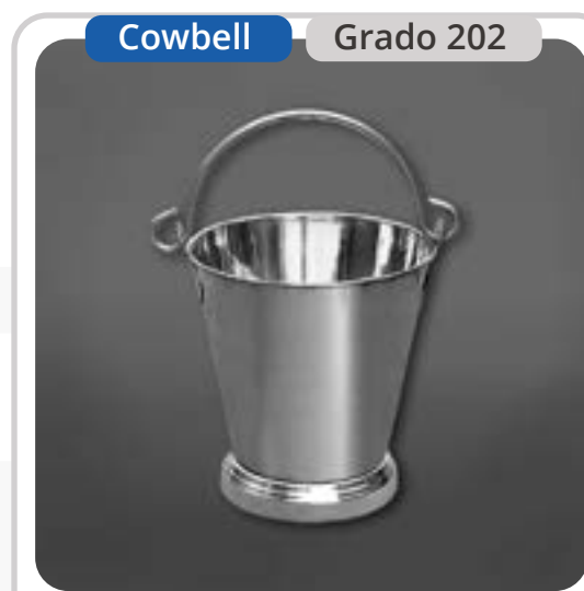
SKU: BD7INOX Balde Acero Inoxidable 7 Lts.