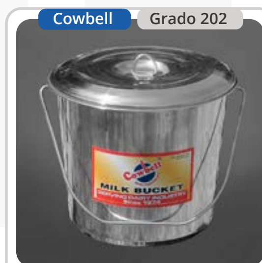
SKU: BD13CTINOX Balde Acero Inoxidable 13 Lts.