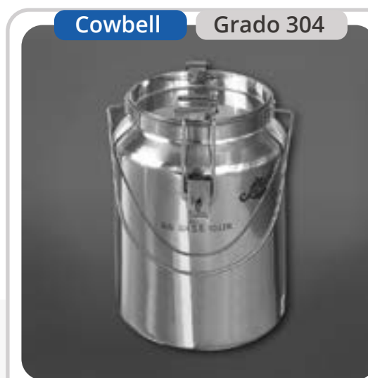
SKU: B10INOX Bidón Lechero 10 Litros Sellable