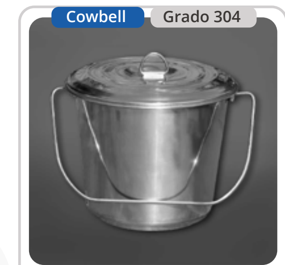
SKU: BD7CTINOX3 Balde de Acero Inoxidable 7 Lts.