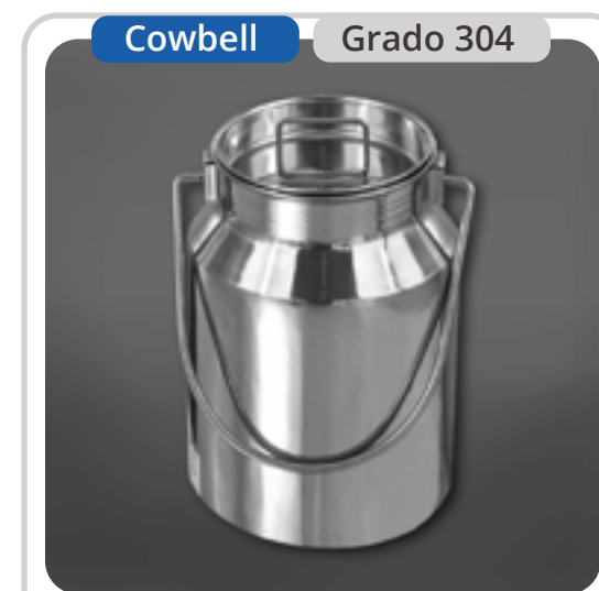
SKU: BL2INOX Bidón Lechero 2 Litros

Descubre nuestra gama de bidones lecheros de acero inoxidable 304 grado alimenticio, disponibles en capacidades de 5 a 50 litros. Robustos, duraderos y fáciles de limpiar, aseguran higiene óptima y un sellado hermético que mantiene la frescura y calidad de tus productos. Ideales para leche, azúcar, granos de café y más, combinan funcionalidad con un diseño clásico y acabado espejado que aporta elegancia en cualquier entorno, ya sea doméstico o profesional.