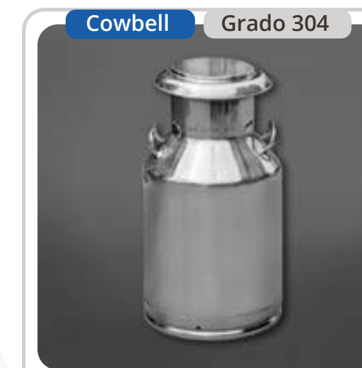
SKU: BL40INOX Bidón Lechero 40 Litros