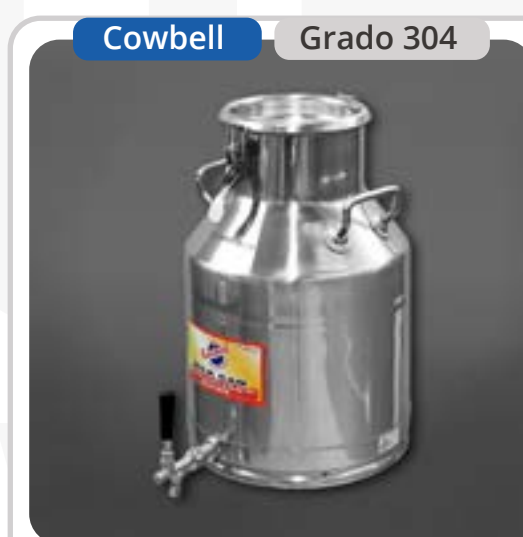
SKU: B30INOXCLL Lechero de 30 Lts con Llave Sellable