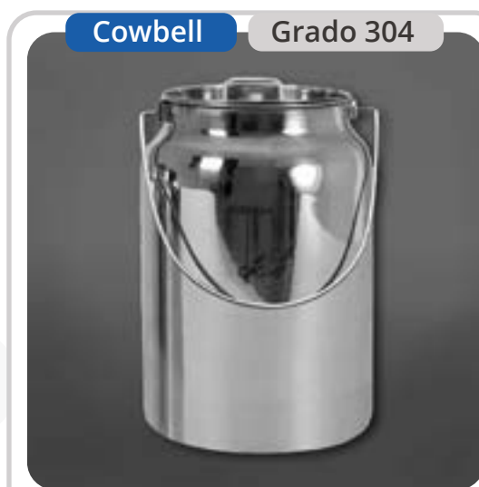
SKU: BL10INOX Bidón Lechero 10 Litros