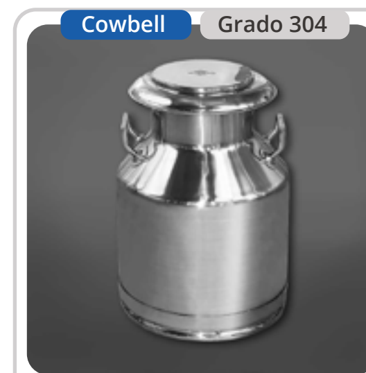
SKU: BL30INOX Bidón Lechero 30 Litros