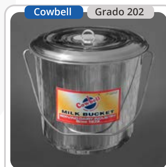
SKU: BD17CTINOX Balde Acero Inoxidable 17 Lts.