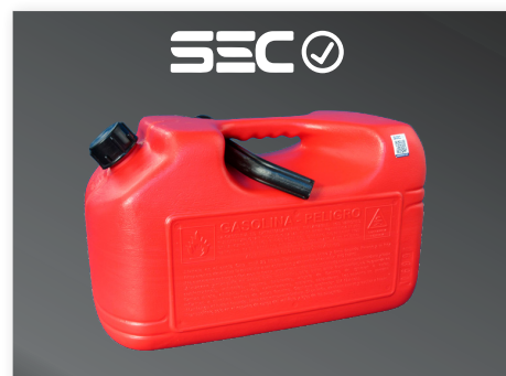
Bidón 20 lt. plástico para Gasolina - Bencina