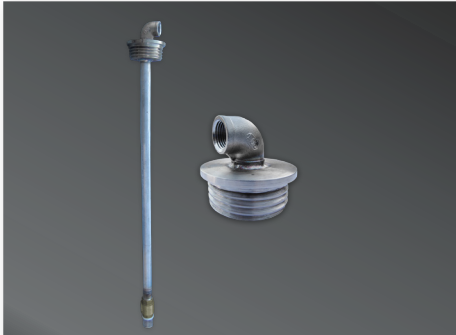
Conjunto Inoxidable Caño Succión y Retorno

A continuación, puedes encontrar nuestras soluciones para roscar y extraer el combustible desde nuestros tambores o estanques IBC. Desde soluciones locales hasta acoples de la más alta gama. Estas soluciones están enfocadas en extraer el combustible, protegiendo a las personas y el medio ambiente. Para más asesoramiento, no dudes en contactar a nuestro departamento técnico.