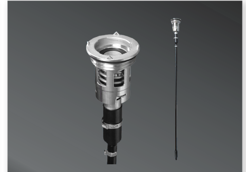
Kit de Sistema de Succión para Tambor o IBC