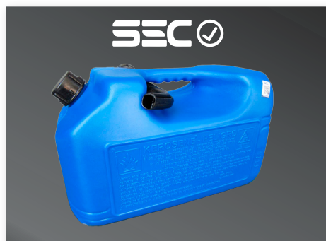
Bidón 20 lt. plástico para Kerosene - Parafina

Los bidones plásticos para combustibles son fabricados con polietileno de alta densidad con filtro UV (3 años), cuentan con un caño para el vaciado que reduce su boca a 22 mm. Su finalidad es para uso doméstico, por lo que se debe tener en cuenta las precauciones y cuidados durante la manipulación, traslado y almacenamiento. Esta información la puedes encontrar en el costado del envase.