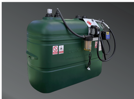
Kit Estanque Doble Pared 1000 Lt. para Petróleo

Los estanques de doble pared están disponibles en capacidades de 1.000 litros, con un kit para el trasvase de 220 V, y de 2.000 litros, sin kit para el trasvase. Esta característica de doble pared permite, en caso de fugas, retener el 100% del producto contenido en su tanque interior, eliminando la necesidad de una bandeja adicional. Además, el filtro de luz impide la formación de algas en el petróleo.