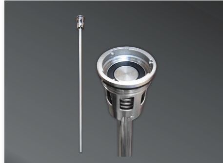
Válvula de Recipiente RSV c/ Tubo Descendente