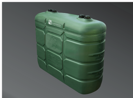
Estanque Doble Pared 2.000 Lt. para Petróleo