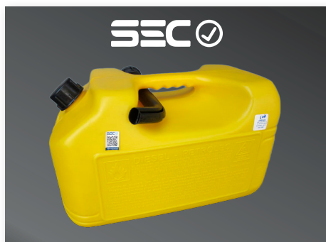
Bidón 20 lt. plástico para Diésel - Petróleo