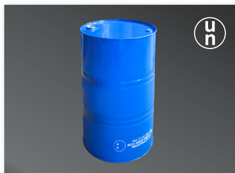
Tambor Metálico de 208 lt. UN

Nuestros tambores certificados, disponibles en variantes metálicas y antiestáticas, son ideales para el transporte y almacenamiento seguro de mercancías peligrosas. Los tambores metálicos, aprobados por la UN y DIRECTEMAR, están fabricados en acero de gran espesor con revestimiento epoxi fenólico, adecuados para combustibles como diésel, gasolina y kerosene. Los tambores antiestáticos de SCHÜTZ, hechos de PEHD, previenen la acumulación de cargas electrostáticas y son ideales para líquidos inflamables.