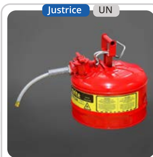
SKU: B9METR Bidón Metálico 9 Litros