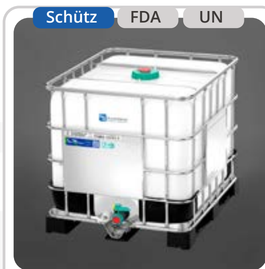
SKU: E820NFDA IBC 820 Litros UN FoodCert