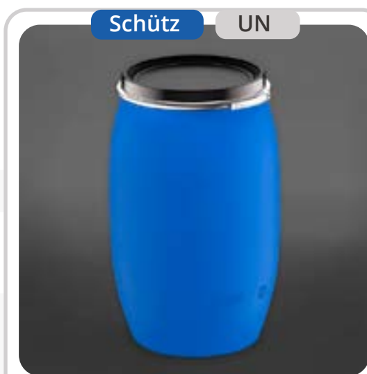
SKU: T120TGNUN Tambor de 120 Litros UN