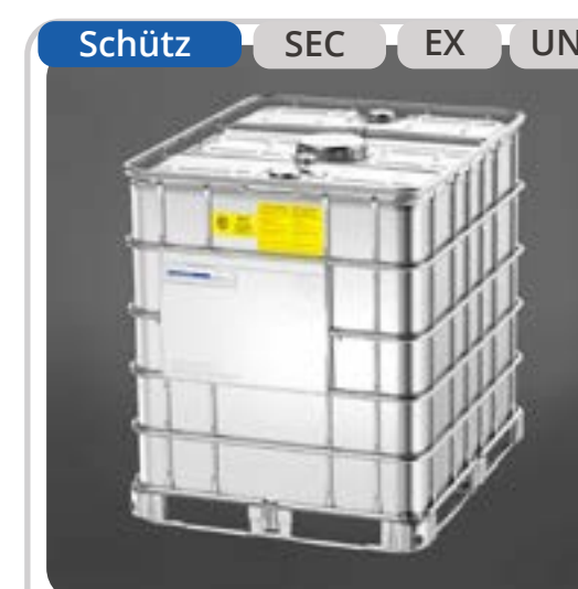
SKU: E1000SD IBC Combustible 1000 Litros SEC