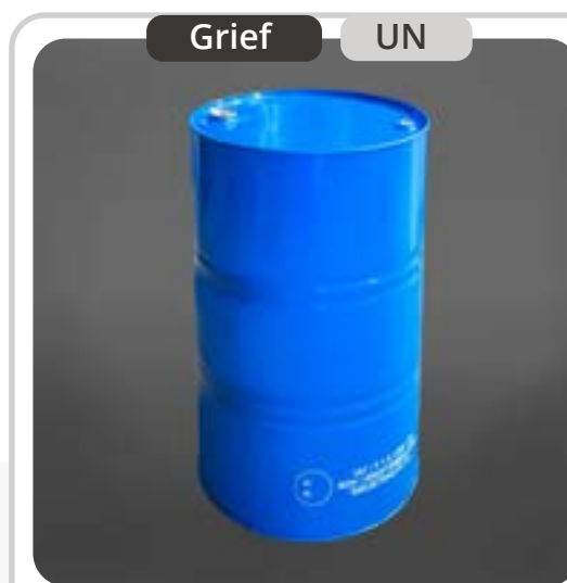
SKU: T208UN Tambor Metálico de 208 Litros UN