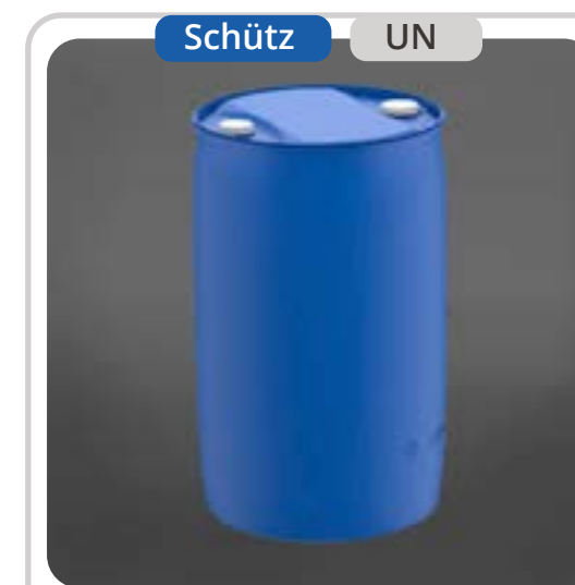
SKU: T210F1 Tambor Plástico de 210 Lts Azul