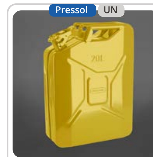
SKU: B20META Bidón 20L para Petróleo o Diésel