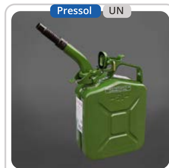
SKU: KB5METP Bidón 5 Lts. para Combustible

Presentamos nuestra línea de bidones metálicos certificados por UN, ideales para el almacenamiento y transporte seguro de combustibles, petróleo y diésel. Disponibles en capacidades de 5, 10 y 20 litros, estos bidones vienen en colores verde, rojo y amarillo, cada uno diseñado para cumplir con los más altos estándares de seguridad y durabilidad en entornos industriales y de transporte.