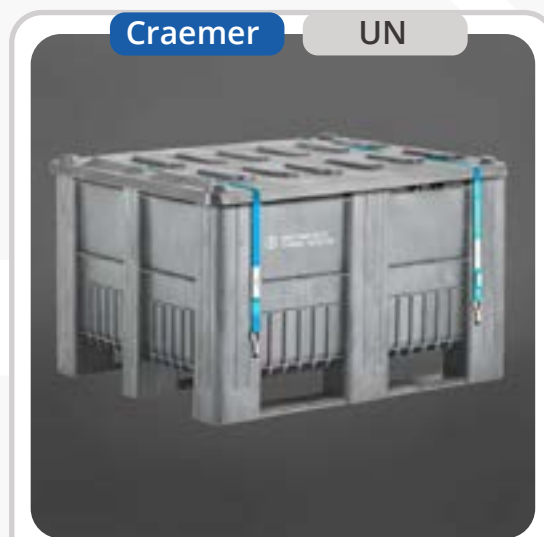
SKU: PBCB3GRUN Bins UN Baterías de Litio 610 lts