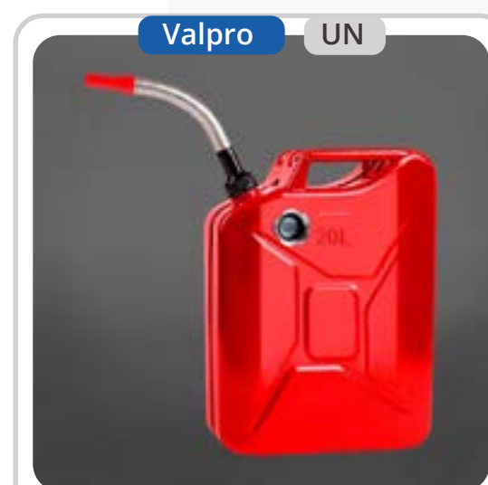
SKU: KB20PROP Bidón 20 Litros para Gasolina