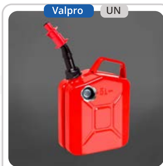
SKU: KB5PROP Bidón 5 Litros para Gasolina con Caño