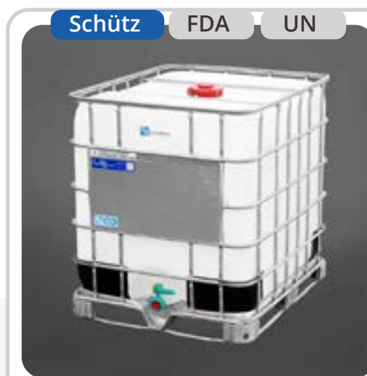
SKU: E1000BNPER-1 IBC Mixto 1000 Litros Palet Metal.