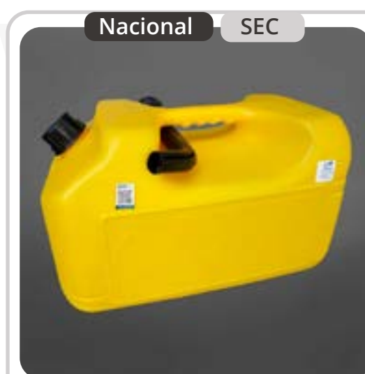
SKU: B20COMBAM Bidón de 20 litros para Diésel