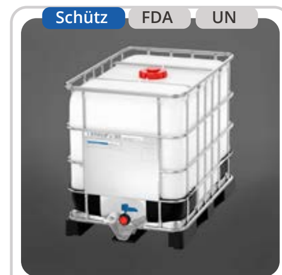
SKU: E640MX IBC 640 Litros IBC UN

Presentamos nuestra línea de Estanques IBC certificados por UN, diseñados para el almacenamiento seguro de líquidos en grandes volúmenes. Disponibles en capacidades de 640, 820 y 1.000 litros, estos estanques ofrecen opciones con características específicas como válvula esférica Camlock, diseño cónico y certificación FoodCert. Con modelos en color negro y natural, garantizan durabilidad y adaptabilidad para diversas aplicaciones industriales, asegurando una gestión eficiente de líquidos en entornos exigentes.