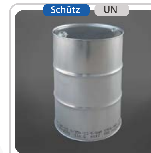
SKU: T216SSF Tambor Metálico 216 Lts