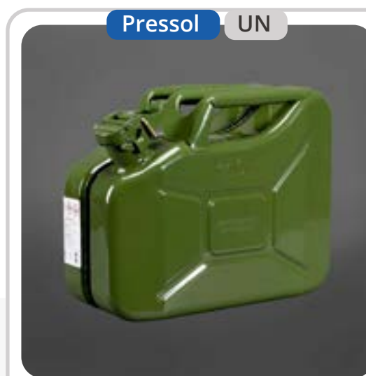
SKU: B10MET Bidón 10 Litros para Combustible