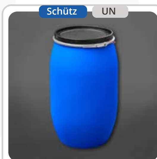
SKU: T220TGNUN Tambor de 220 Litros