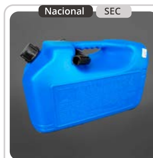
SKU: B20COMB Bidón de 20 Litros para Kerosene