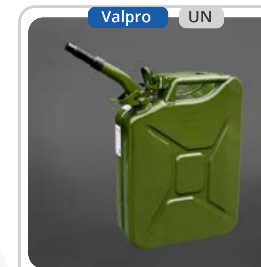
SKU: KB20METVP Bidón de 20 Lts. para Combustible