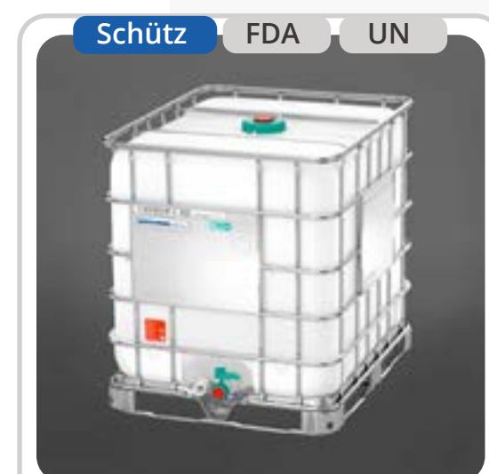
SKU: E1000NFDA IBC 1000 Litros FoodCert MX UN