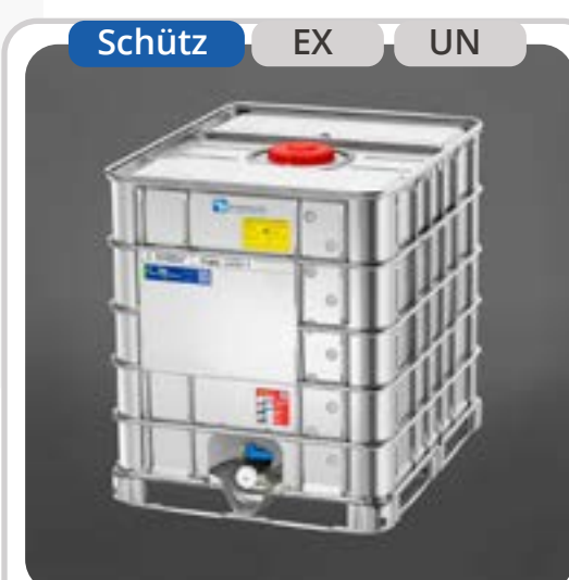
SKU: E1000SXEX IBC Antiestático de 1000 litros SX-EX