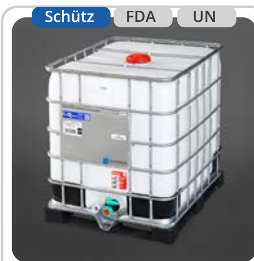
SKU: E1000BNPER IBC Mixto 1000 Litros Palet Plasti.