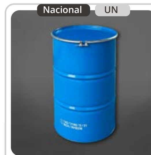
SKU: T55GTMSR Tambor Metálico de 208 Lts con Aro