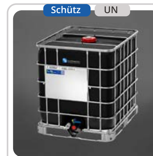
SKU: E1000BLACK IBC 1000 Litros Negro MX-UN