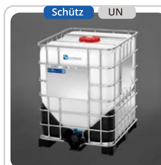
SKU: E1000HX IBC Fondo Cónico 1000 Lts IBC HX