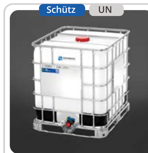
SKU: E1000UN IBC 1000 Litros UN para Químicos