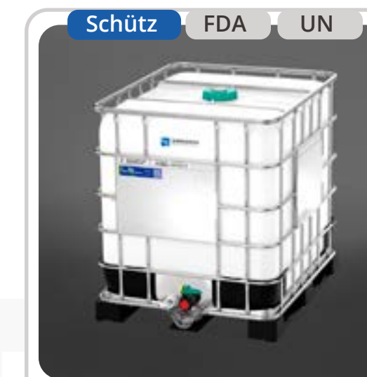
SKU: E1000UNFC IBC 1000 Lts UN Patín Plástico