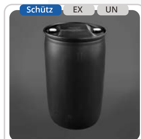
SKU: T220EXF1 Tambor Antiestático 220 Lts