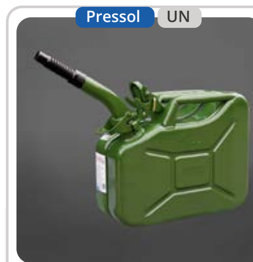
SKU: KB10METP Bidón de 10 Litros para Combustible