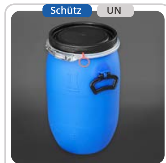
SKU: T30UN Tambor Plástico de 30 Lts. con Aro

Explora nuestra completa gama de Tambores UN, ideales para el almacenamiento seguro de líquidos y sólidos en entornos industriales. Disponibles en capacidades de 208 a 220 litros, ofrecemos tambores plásticos, metálicos y galvanizados, con opciones como tapa removible, certificación IATA y modelos antiestáticos. Con diseños robustos y certificados, estos tambores aseguran máxima protección y versatilidad en el manejo de materiales peligrosos o sensibles.