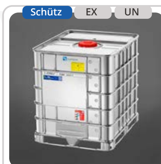
SKU: KE1000SXEXP IBC Conductivo 1000 Lts.