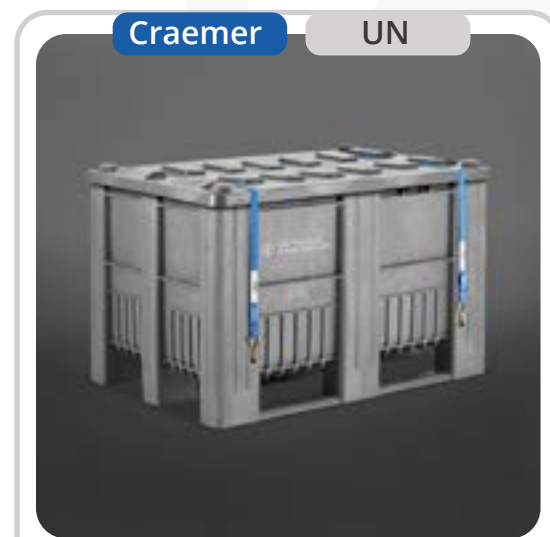
SKU: PBCB1GRUN Bins UN Baterías de Litio 470 lts

Presentamos nuestros Bins UN de 610 litros, especialmente diseñados y certificados para el transporte seguro de baterías. Estos bins ofrecen una solución robusta y confiable para el manejo de materiales peligrosos durante su traslado. Su certificación UN garantiza que cumplen con los más altos estándares de seguridad, proporcionando tranquilidad y protección en el transporte de baterías a nivel industrial.