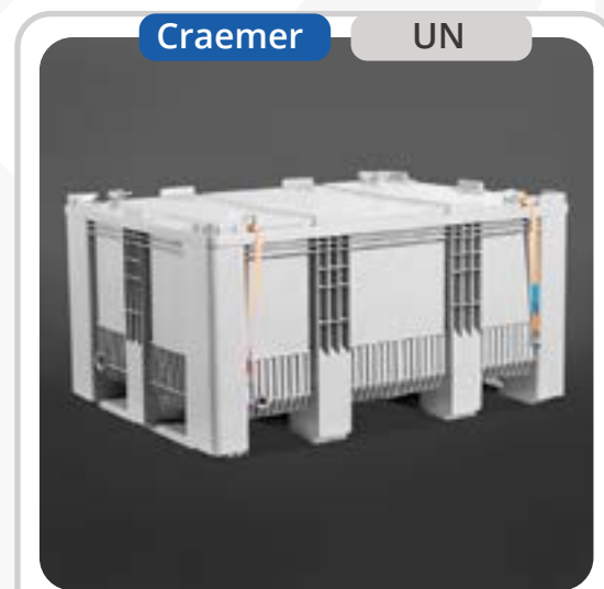
SKU: PBSB3GRUN Bins UN Baterías de Litio 999 lts