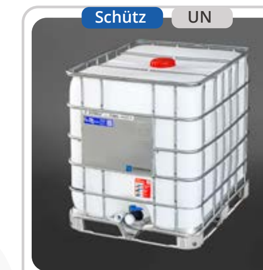
SKU: E1000UNCTV IBC 1000 Lts UN Camlock T. Ciega