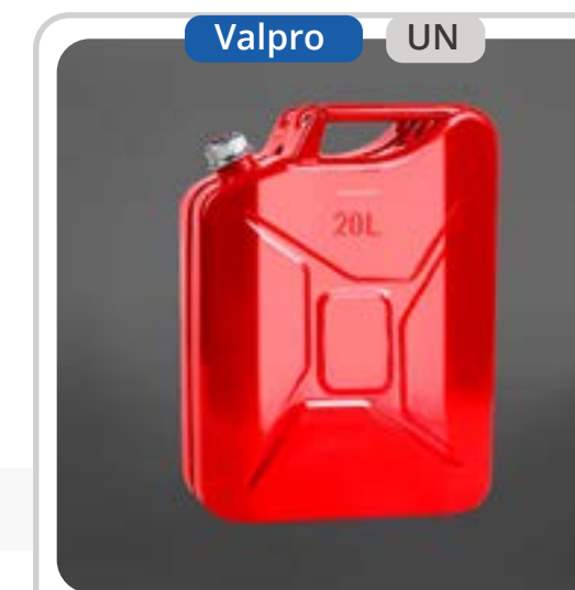
SKU: B20METPROR Bidón de 20 Litros para Bencina