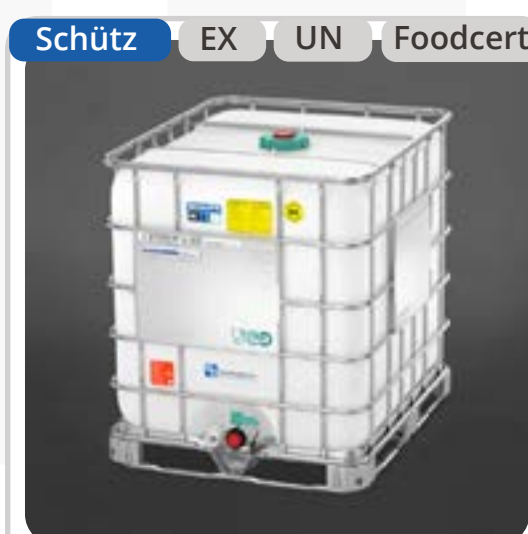
SKU: E1000MXEXF Antiestático 1000 Lts Foodcert UN