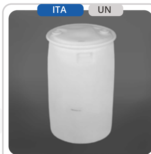
SKU: T205TCHI Tambor Plástico 208 L UN