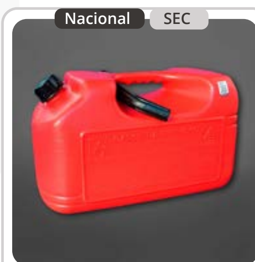
SKU: B20COMBR Bidón de 20 Litros para Gasolina