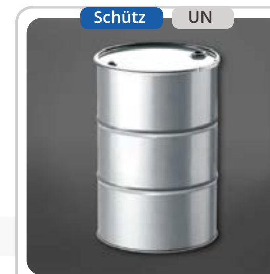
SKU: T216SDF Tambor Metálico con Aro 213 Litros