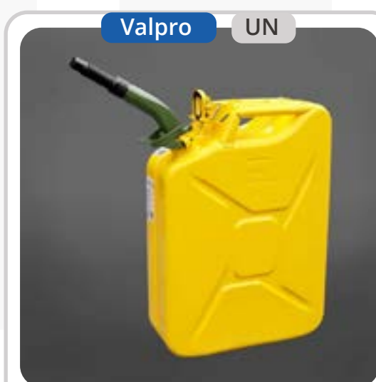
SKU: KB20METAP Bidón para Diésel de 20 litros